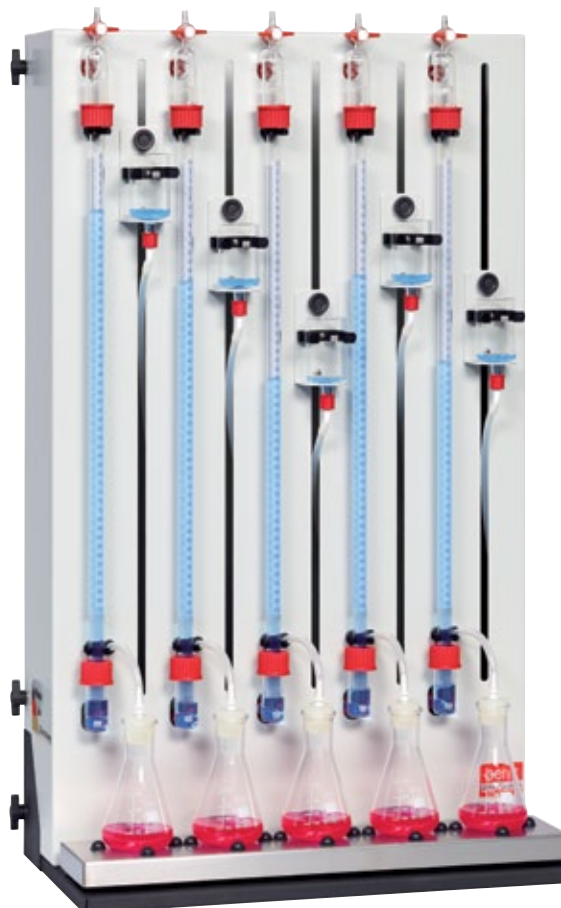
2 SCM 5