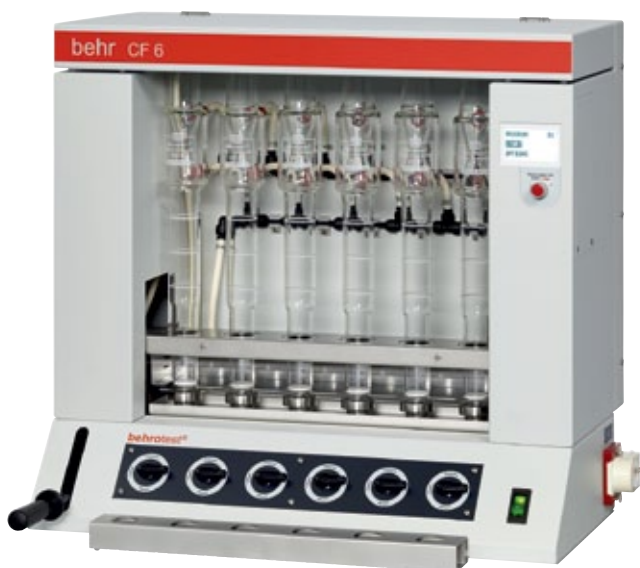
3 CF 6