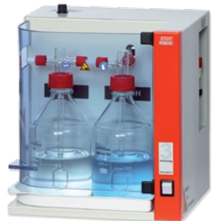
5 behrosog 3