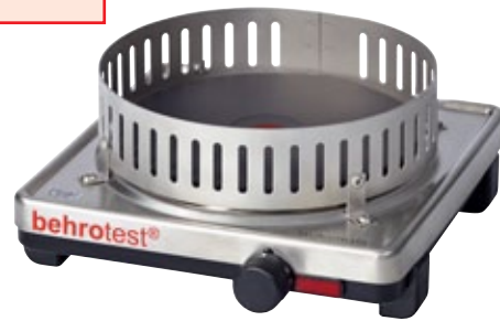
6 KP 4

Detaillierte Informationen finden Sie in unserer Spezialbroschüre: Das behr-Programm für Rohfaser