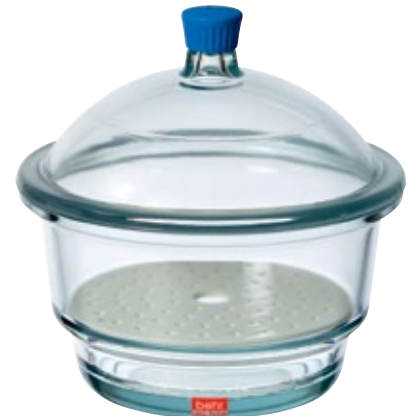
7 EXK 300