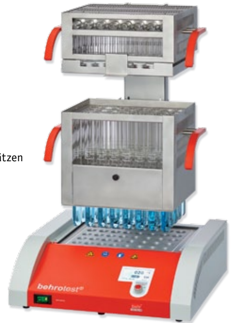
2 K 40