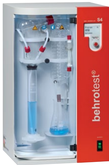
4 S 4