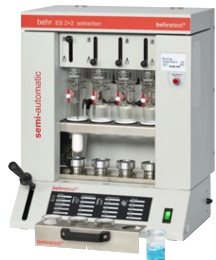
3 ES 2+2

Detaillierte Informationen finden Sie in unserer Spezialbroschüre: Das behr-Programm für Extraktion/ Destillation