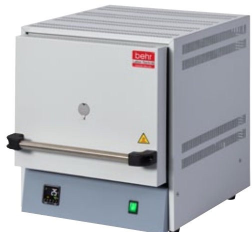
5 MO 8