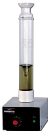
3 IMR 10 E