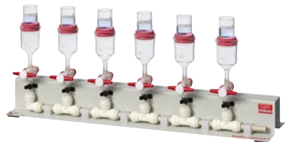
2 SC 6