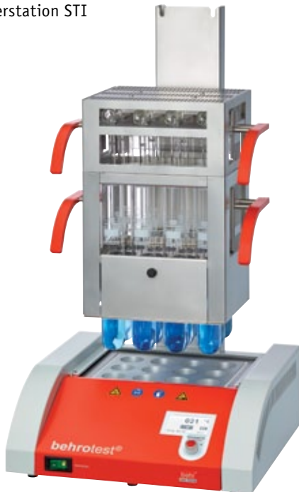
1 K 12