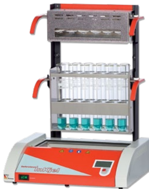
4 InKjel 1225 TCP