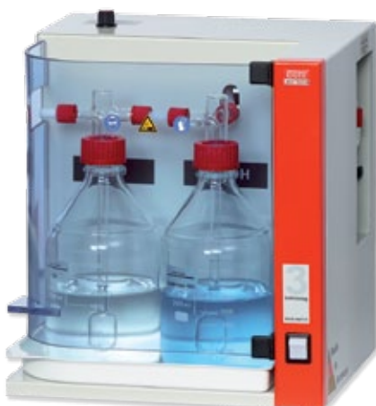
3 behrosog 3