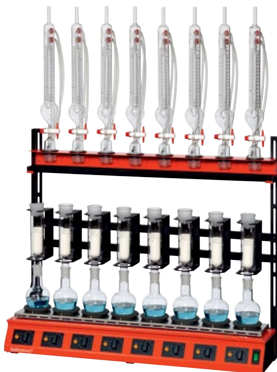
2 R 108 T-FB