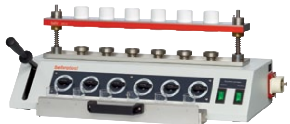
4 DG 6