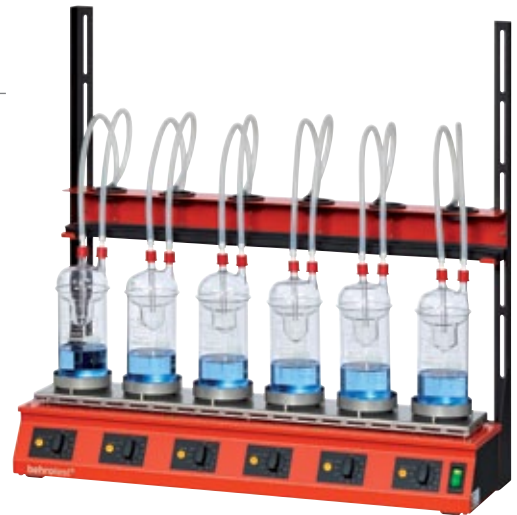
1 EXR 6