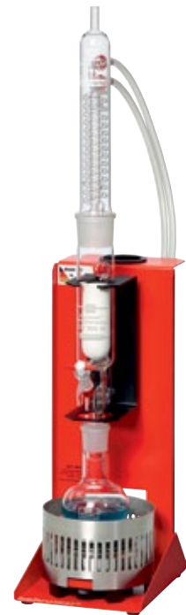
1 KEX 100 F-FB