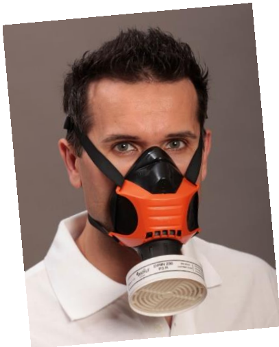
ماسک نیمه صورت Polimask ALFA