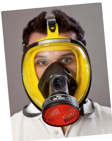
ماسک تمام صورت SFERA/Silicone (کلاس 3)