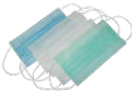
یک بار مصرف سه لایه