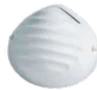
ماسک نمودی کاسه‌ای