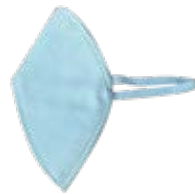
ماسک نمودی تاشو